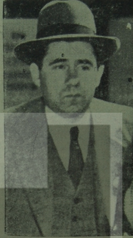
Sovyet Dışişleri Bakanı Yavaş yavaş gelin

Ordu içinde ihtilâl hazırlığı yapıldığı, haftanın başında Genel Kurmay Başkanı Orgeneral Cevdet Sunay tarafından açıklanmıştır. Sunay, Meclis Başkanları ile Başbakanı gönderdiği mektupta, «sürdürülen anarşi ile bir silâhli ihtilâle gidiyoruz. Derhal tedbir alınmalıdır» demiştir. Sunay, özellikle, gerici ana muhalefet partisi ile bu partiyi destekleyen vur